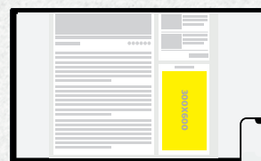
300x600 Internas Desktop e Mobile