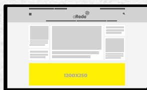
1200X250 Home e Internas Desktop