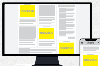
300x250 Home e Internas Desktop e Mobile